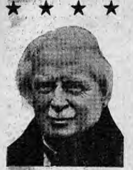
DAVID LLOYD GEORGE el ex - Premier británico, se propone volver a la política activa invocando la necesidad de un "nuevo trato" para Inglaterra.